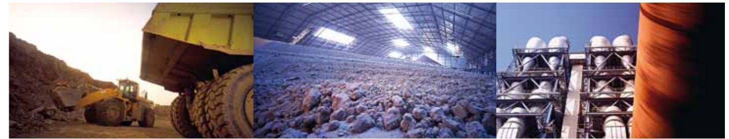
1. Sprengung des Kalksteins im Steinbruch