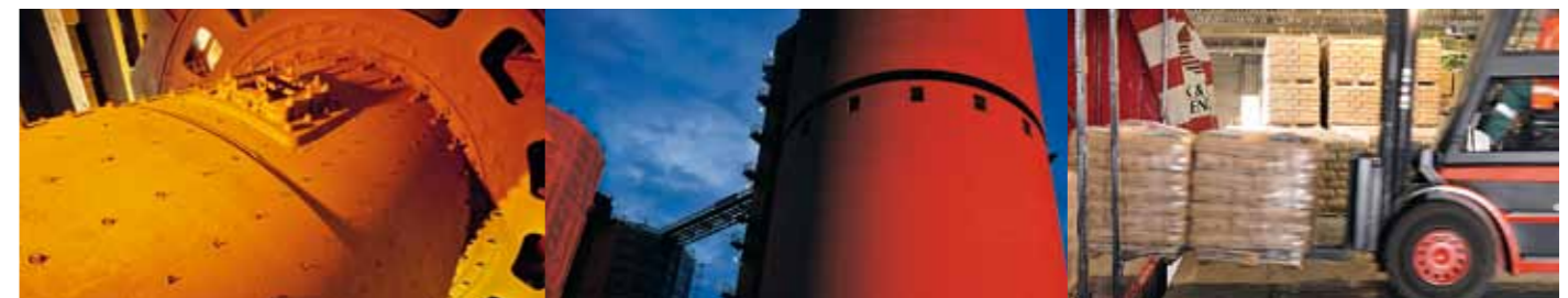
4. Mahlen des Klinkers zu Zement unter Zugabe von Gips sowie weiteren Hauptbestandteilen in der Kugelmühle